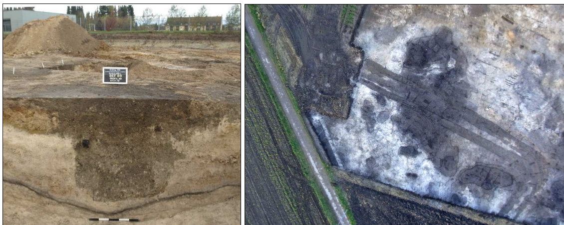
Abb. 2 Links: Profil einer Pfostengrube des spätlatènezeitlichen Gebäudes im Westteil des Grabungsareals. Rechts: Luftbild der Südostecke des Grabungsareals mit Grabenwerk (Norden ist rechts).

Zu Tage kamen – im äußersten Westen des Grabungsareals – weitere Befunde der bereits 2004 gegrabenen, spätlatènezeitlichen Siedlung. Ein Gebäude passt geradezu idealtypisch in diesen Zeitabschnitt. Es handelt sich um ein aus mächtigen Pfosten konstruiertes Geviert mit enger gestellten, kleineren Pfostengruben vor der Nordseite (Abb. 1, 2 links). Ein nur noch fragmentarisch erhaltenes Gräbchen, dessen Orientierung der Ausrichtung des Pfostenbaus entspricht, war vermutlich Teil einer rechteckigen Umfassung dieses Gebäudes aus dem 2. Jh. v. Chr.