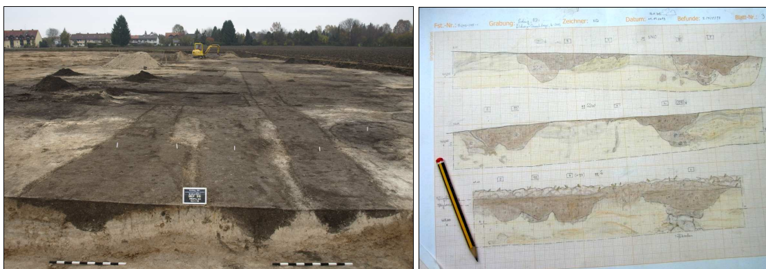
Abb. 4 Links: Profil im Südteil gegen Norden. Rechts: Profilzeichnungen zum Grabensystem.

Eine frühmittelalterliche Pfeilspitze aus der oberen Verfüllung des Grabens, der im Norden einen Annex bildet, stellt nun aber die anfänglich vermutete Datierung in Frage. Durch zahlreiche Profile konnte die Struktur und Phasigkeit des komplexen Grabensystems bereits weitgehend geklärt werden (Abb. 4, 5).