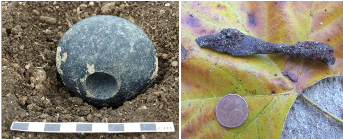
Abb. 3 Links: jungsteinzeitlicher Keulenkopf. Rechts: frühmittelalterliche Pfeilspitze.

Die Südostecke des Grabungsareals wird dominiert von einem mehrphasigen Grabenwerk (Abb. 1, 2). Der Fund einer fein geschliffenen Keule aus einer der zahlreichen Humuslinsen im Nahbereich des Grabenwerkes und eine Silexpfeilspitze ließen zunächst vermuten, es handle sich um eine Anlage des Spätneolithikums (Abb. 3 links).